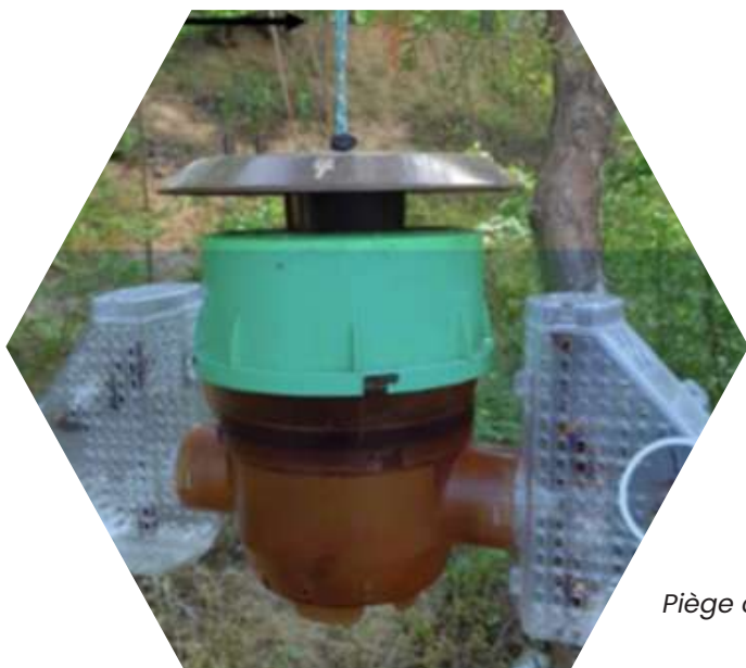
Piège coréen à ailes