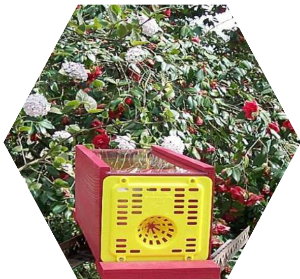
Piège chez un particulier