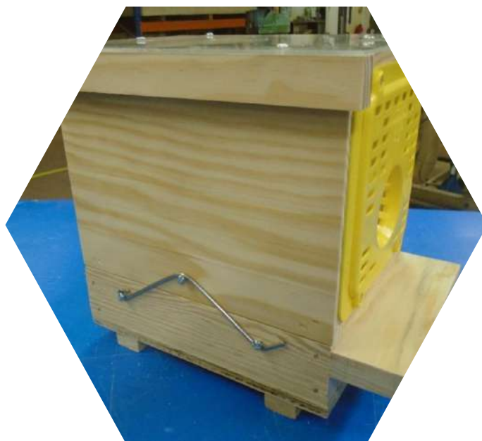
Piège nasse à grilles Néoppi jaunes

Renouveler l'appât au plus tous les 8-10 jours, en laissant quelques frelons vivants à l'intérieur du piège, les phéromones attirent les frelons et repousseraient les autres insectes.