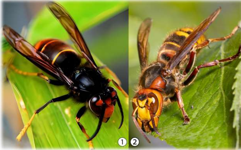
Frelon à pattes jaunes

Il se nourrit de pollen, de nectar, de fruits et d'insectes. Il est souvent confondu avec le frelon européen qui, en comparaison, a un abdomen jaune vif avec des bandes noires et des pattes marrons et est légèrement plus grand que le frelon à pattes jaunes.