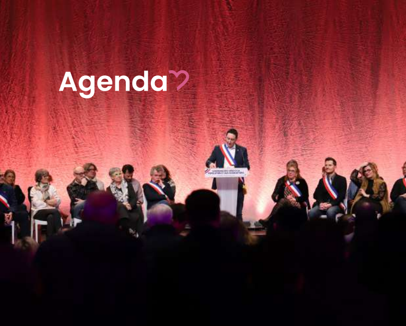
CÉRÉMONIE DES VOEUX À LA POPULATION Le vendredi 9 janvier 2026, salle Jacques Brel