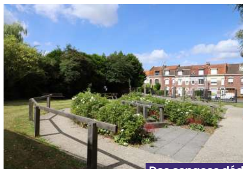
Des espaces dédiés à la détente