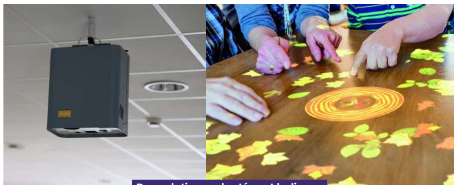
Des solutions adaptées et ludiques