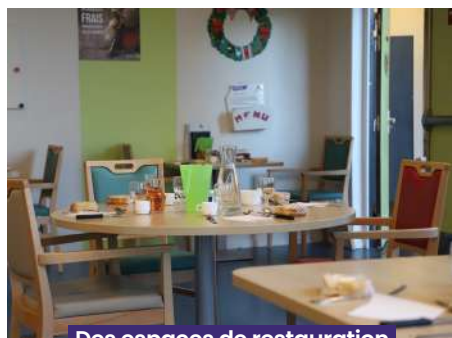
Des espaces de restauration