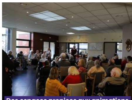
Des espaces propices aux animations